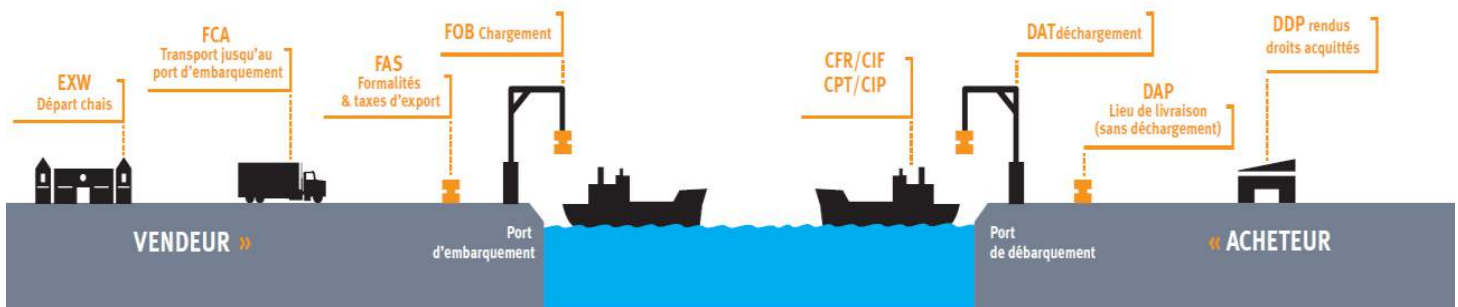
Schéma de l'exportation du vin (source CIVB).